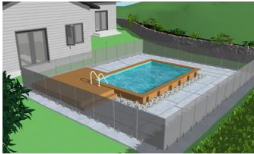
Une enceinte doit être installée à plus de 1 m d'une fenêtre susceptible de permettre à un enfant d'accéder à l'intérieur de celle-ci.